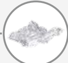
La frigolite, les papiers aluminium et cellophane