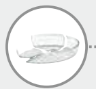
Les verres résistant aux hautes températures