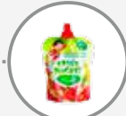
Tous les autres emballages et objets en plastique