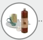
La porcelaine, la céramique et la terre cuite