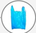
Tous les sacs et films en plastique