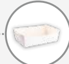
Les papiers et cartons sales