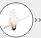
Les ampoules économiques et les tubes néon