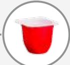
Le pot de yaourt