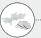
Le verre plat tel que vitres et miroirs, l'opaline et le cristal