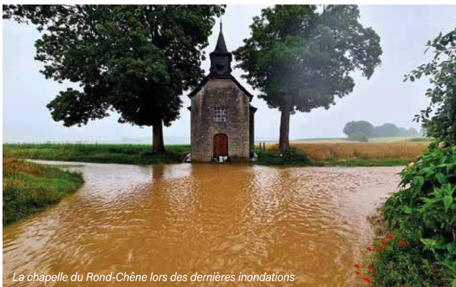
La chapelle du Rond-Chêne lors des dernières inondations