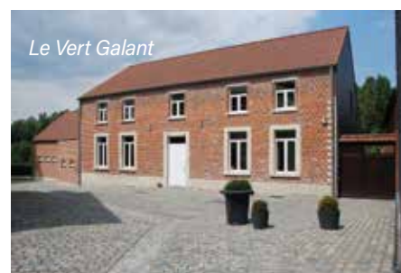
Le Vert Galant

étudiante en master Patrimoine – Erasmus Mundus Dyclam+, stagiaire affectée au projet par le biais du Comité belge du Bouclier Bleu.