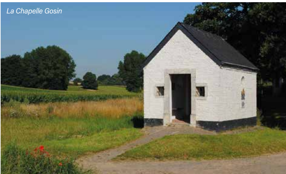
La Chapelle Gosin