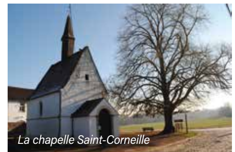
La chapelle Saint-Corneille

Il revient aux Etats de définir souverainement les biens culturels qu'ils estiment rentrer dans le champ d'application de cette définition. Si au niveau des biens immobiliers wallons, le Ministre du Patrimoine a indiqué qu'il s'agissait de l'ensemble des biens classés, la question de la sauvegarde du patrimoine n'est pas qu'une question