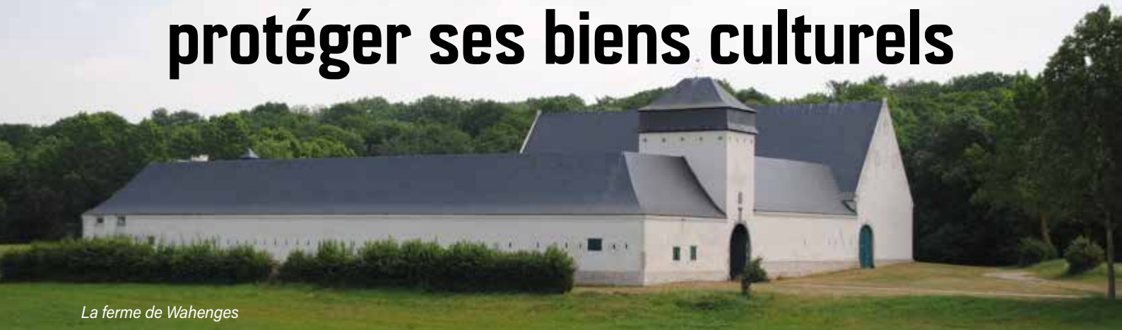
La ferme de Wahenges