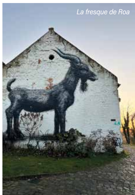
La fresque de Roa

Eviter un risque ou minimiser les dommages infligés à un bien culturel, c'est aussi un gage de sérieuse économie pour les deniers publics.